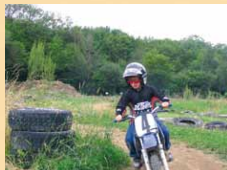
Les mini-motos doivent être réservées à l'initiation des enfants sur des terrains aménagés à cet effet.

Référence : article L 321-1-1 du Code de la Route.